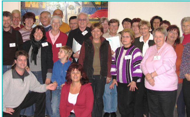
Wir freuen uns mit unseren Ehrenamtlichen auf neue KollegInnen

Lust aufs Ehrenamt bei uns? Wir beraten Sie gerne!