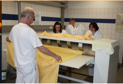
Arbeitsfeld: Arbeitshilfen und Ausbildung für Menschen mit Vermittlungshemmnissen