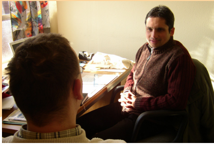
Arbeitsfeld: Beratung von Wohnungs- und Arbeitslosen