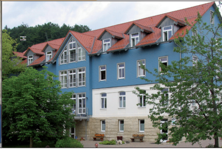
Rund 120 Plätze: Pflegeheim und Soziale Heimstätte