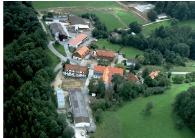
Der Stammsitz der ERLACHER HÖHE mit Sozialer Heimstätte, Pflegeheim, Zentraler Verwaltung sowie Werkstätten, Küche und Wäscherei der Erlacher Arbeitshilfen