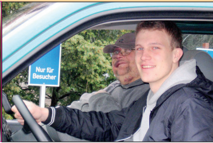
Unverzichtbare Hilfe: Fahrdienste für die Bewohner Zusatzprogramme an ( www.ran-ans-leben-diakon )