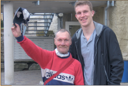
Soziale Kompetenzen erwerben, Toleranz üben