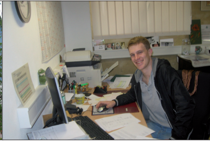
Auch Büroarbeiten gehören zu den Aufgaben im FSJ/BFD Wichtig sind ein offenes Ohr und Zeit für Gespräche