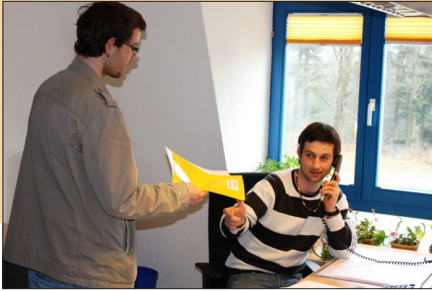
Teamwork wird großgeschrieben