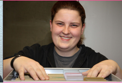
Büroorganisation kann richtig Spaß machen