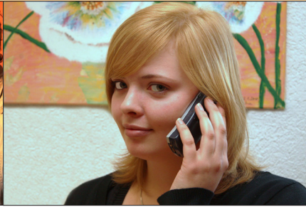
Professionell Auskunft geben in der Telefonzentrale