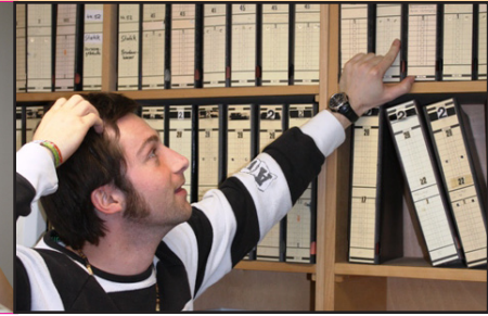
Das „Gedächtnis“ der Einrichtung: Archiv und Regis