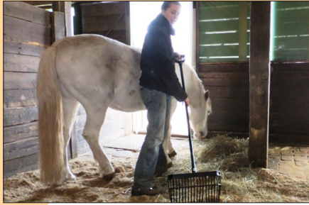
Hausputz bei den Pferden des Gnadenhofs