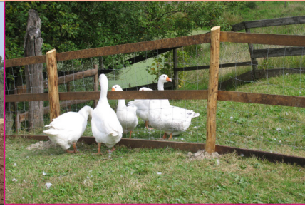
Statt Wachhunde: die Gänse der Hellen Platte