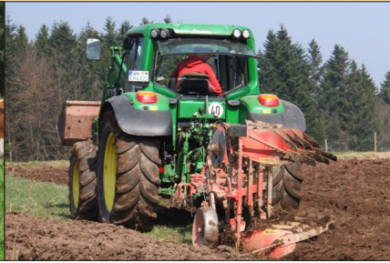
Gewirtschaftet wird nach Demeter-Grundsätzen