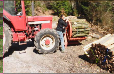
Das Aufgabengebiet umfasst auch Arbeiten im Forst