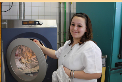
Wäschereitechnik und Textilkunde sind Unterrichtsstoff