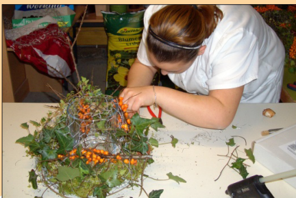
Ein Händchen für Farben und Formen ist gefragt