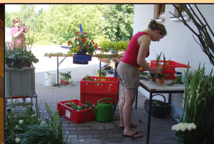
Hier entsteht die Blumendeko fürs Erlacher Jahresfest