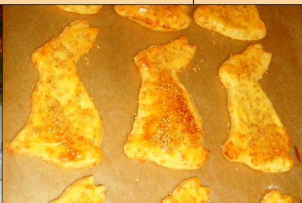
Saisonales Gebäck für das Erlacher Pflegeheim