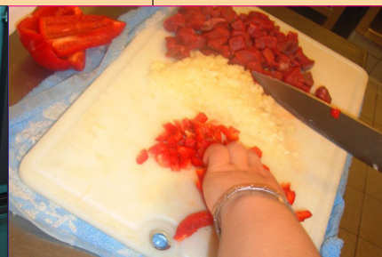
Allrounder in Sachen Haushalt: auch in der Küche