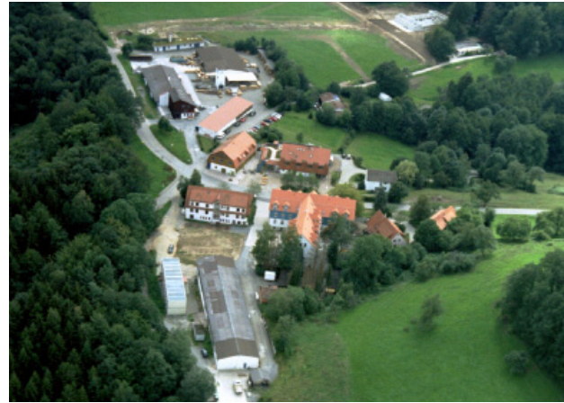
Der Stammsitz der ERLACHER HÖHE mit Sozialer Heimstätte, Pflegeheim, Zentraler Verwaltung sowie Werkstätten, Küche und Wäscherei der Erlacher Arbeitshilfen

Einfühlungsvermögen, Geduld, Konflikt- und Teamfähigkeit sind wichtige Eigenschaften in diesem Beruf. Doch auch Organisations-talent und Spaß an kalkulatorischen Aufgaben sollte mitgebracht werden. Diese bundesweit geregelte dreijährige Ausbildung zum/-r Hauswirtschaftler/-in und zum/-r hauswirtschaftlichen Helfer/-in wird in den Bereichen Hauswirtschaft und Landwirtschaft angeboten. Dienstleistungsunternehmen wie Kantinen, Hotel- und Cateringbetriebe können Hauswirtschaftler/-innen ebenfalls ausbilden. Die Ausbildung findet zumeist im Wechsel von betrieblicher und berufsschulischer Ausbildung statt. Nach erfolgreichem Abschluss eröffnen sich interessante und vielseitige Aufstiegs- und Weiterbildungsmöglichkeiten zum Beispiel zur Altenpflegerin, zur/-m Hotelfachfrau/-mann, zum Koch bzw. zur Köchin oder zur/-m Kinderkrankenschwester/-pfleger.