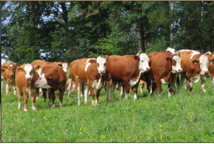
Mutterkuhhaltung – ganz natürlich