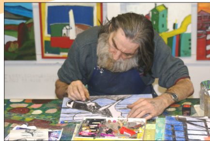
In der Kreativwerkstatt „Treff“ kann man morgens von 8 bis 12 Uhr den Künstlern über die Schulter schauen