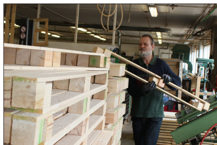
Für Industriepartner fertigen wir individuell unterschiedlichste Einwegpaletten, Transportkisten und -vorrichtungen