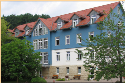
Rund 120 Plätze für wohnungslose Menschen stehen in der Sozialen Heimstätte Erlach zur Verfügung, inkl. Pflegeheim