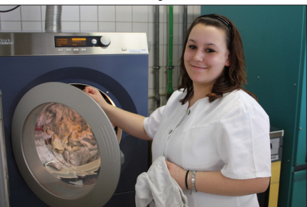
Waschen, Bügeln, Mangeln, Nähen: Die Großwäscherei arbeitet professionell für Groß- und Privatkunden