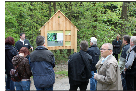
Die „Naturspur“, unser Naturlehrpfad, informiert auf 3 km über Flora & Fauna, nachhaltigen Landbau und Naturschutz