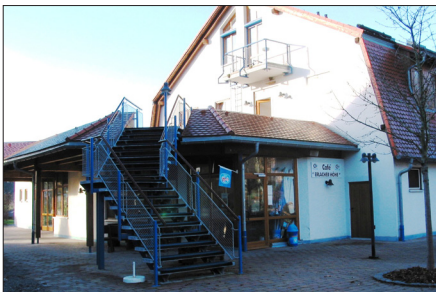
Im Obergeschoss finden Sie die Zentrale Verwaltung der Einrichtung, unten das Café ERLACHER HÖHE