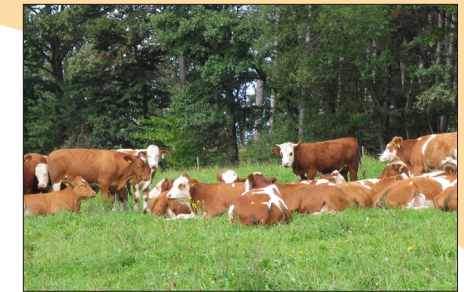
Der Demeter-Biohof „Helle Platte“: 180 ha bewirtschaftete Fläche, Streuobstwiesen, Forst, 150 Rinder, Schweine ...