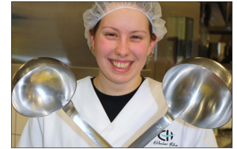
Die Erlacher Großküche versorgt u. a. das Pflegeheim, die Sozialen Heimstätte Erlach und bietet einen Catering-Service