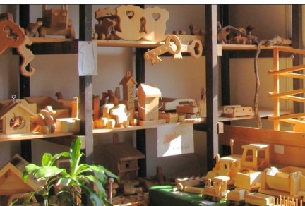
In der Holzwerkstatt gibt es Holz(spiel)waren, Festzeltgarnituren, Nistkästen. Hier wird geschreinert und restauriert