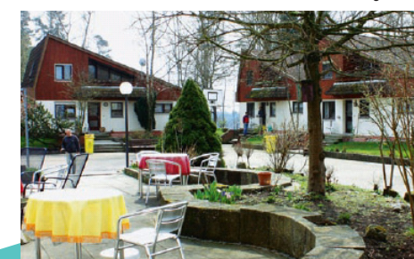
Die stationäre Sozialtherapie in der Dorfgemeinschaft auf der „Hellen Platte“ umfasst rund sechs Monate Aufenthalt